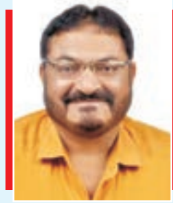
વી. પી. વૈણવ પ્રમુખ